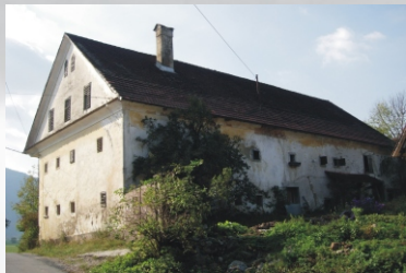
La casa di Lekan

Il villaggio è situato sulla collina di Jakovica (Jakovski hrib) ed è collegato con Laze attraverso una stradina collinare che offre ai visitatori una vista panoramica della Pianura di Planina.