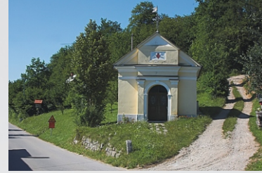
La Cappella del Sacro Cuore di Gesù

Costruita nel sedicesimo secolo, è la più antica abitazione di Laze. La casa è iscritta nel registro sloveno dei beni sotto protezione ambientale e culturale. All'interno si trova un particolare soffitto in legno.