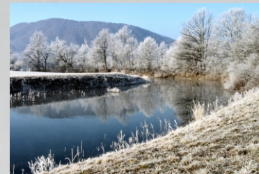
Il fiume Unica

La Pianura di Planina è considerata il tipico esempio di pianura carsica. La sua superficie è di 11 chilometri quadrati. Nella pianura, in direzione nord, scorre il fiume carsico Unica. Spesso in autunno l'Unica, uscendo dai propri argini, trasforma la pianura in un grande lago e quando i livelli sono alti inonda anche le strade che collegano i paesi ai lati della pianura.