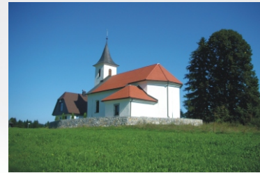
La Chiesa di San Michele

Costruita dagli abitanti di Laze all'inizio del secolo scorso, appartiene alla parrocchia di Planina. La cappella non ha un vero campanile e sulla facciata si notano tre simboli cristiani rappresentanti la fede, la speranza e l'amore. Ogni anno in maggio si svolgono nella cappella i riti liturgici del maggio mariano, mentre la Santa Messa viene celebrata ogni sabato.