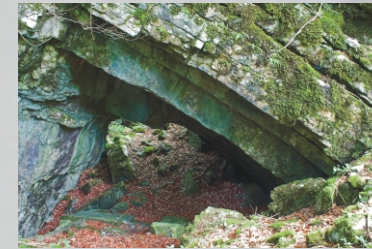
La caverna di Šteklj

La Pianura di Planina è ricca di grotte soprattutto sui lati orientali e settentrionali. In certe zone possiamo trovare più di cinquanta grotte per chilometro quadrato. Le più conosciute sono: Vranja jama con Mrzla jama, Skedenja jama, Najdena jama, Mačkovica e Logarček. Nella Stota jama si trova una formazione calcarea a forma di elefante.