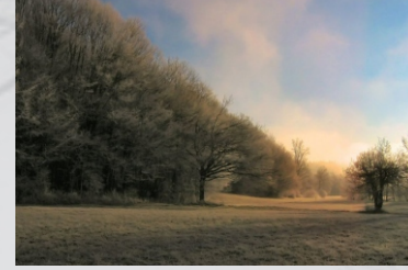
La Pianura di Planina

La cappella di Santa Maria "nel nocciolo" si trova a pochi passi dalla chiesa di San Michele, ma non è subito visibile poiché situata ai piedi della collina di Jakovica, sul lato nord. La cappella è dedicata alla Vergine Maria ed è stata costruita su mura di pietra attorno ad una sorgente d'acqua, il che conferma le sue antiche radici storiche.