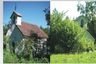
La Cappella di Santa Maria "nel nocciolo"

Nei documenti storici la chiesa di San Michele a Jakovica è nominata per la prima volta nel 1526. Nel 1998 la chiesa è stata completamente ristrutturata e grazie all'illuminazione esterna e alla sua posizione in cima alla collina di Jakovica, oggi è ben visibile ai passanti anche da lontano, specialmente dal lato opposto alla Pianura di Planina.