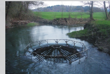
I pozzi di Putik

La piccola caverna di Šteklj ha l'aspetto di una galleria naturale ma in realtà si tratta degli effetti del crollo di una grotta che ha creato anche le due valli confluenti Lavrin e Šteklj. Il carso è in continua trasformazione.